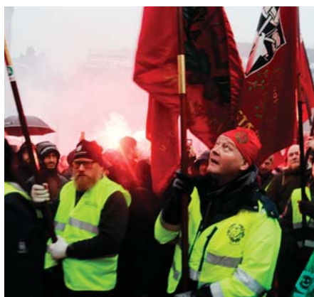
Vi klapper i fællesskab vores forhandlerne ind, når de mødes med arbejdsgiverne.

■ DEMOKRATI I 125 år har vi gjort det. Aftalt en overenskomst med vores arbejdsgivere. Vi kæmper for vores rettigheder og goder, mens arbejdsgiverne ser skarpt på vores pligter. Vi har i fællesskab aftalt og skabt verdens bedste arbejdsmarked og det skal vi forbedre. Demokrati tager tid og overenskomster, der inddrager de fleste arbejdstagere i Danmark, tager meget lang tid. Derfor er der god tid til at drøfte krav og ønsker på klubmøder, lærlingemøder, generalforsamlingen, blandt de tillidsvalgte, i dialog med Forbundet og i vores egen lukkede FB-gruppe.