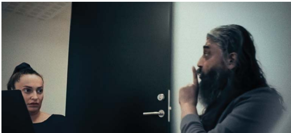
Arbejdskriminelle svindler systematisk med byggeaffald i TV2 dokumentar.

nye ressourcer over for de virksomheder, der igen og igen ignorerer spillereglerne på arbejdsmarkedet. Målet er at stoppe entreprenører, der gentagne gange bryder lovgivning med bedre mulighed for at føre tilsyn med boliger udlejet af deres arbejdsgiver.