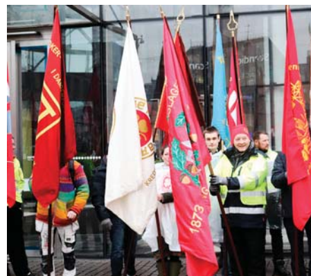
Vi forhandler i et stort solidarisk forhandlingsfællesskab med mange fagforeninger.