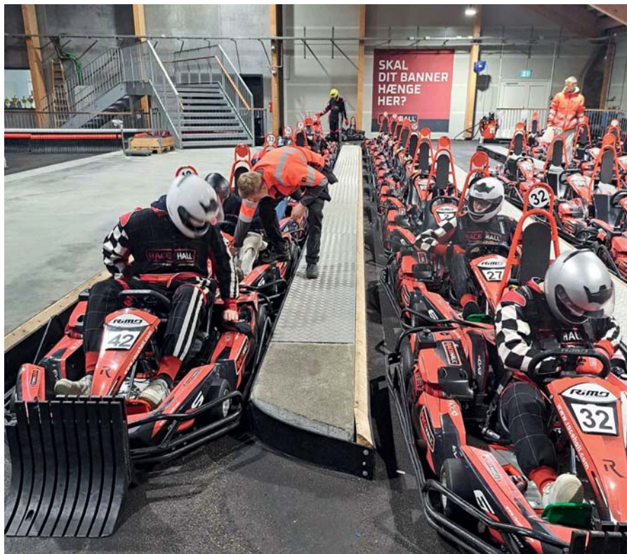
Blikkenslagere kan lide fart og lærlingene kører ræs og taler Årsmøde.