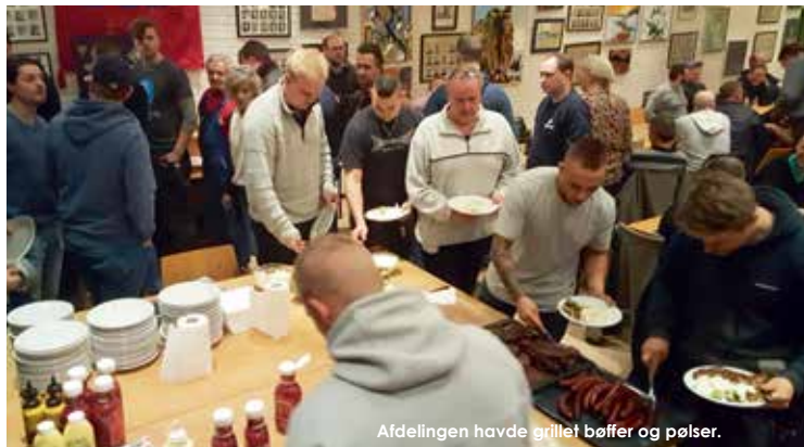
Afdelingen havde grillet bøffer og pølser.