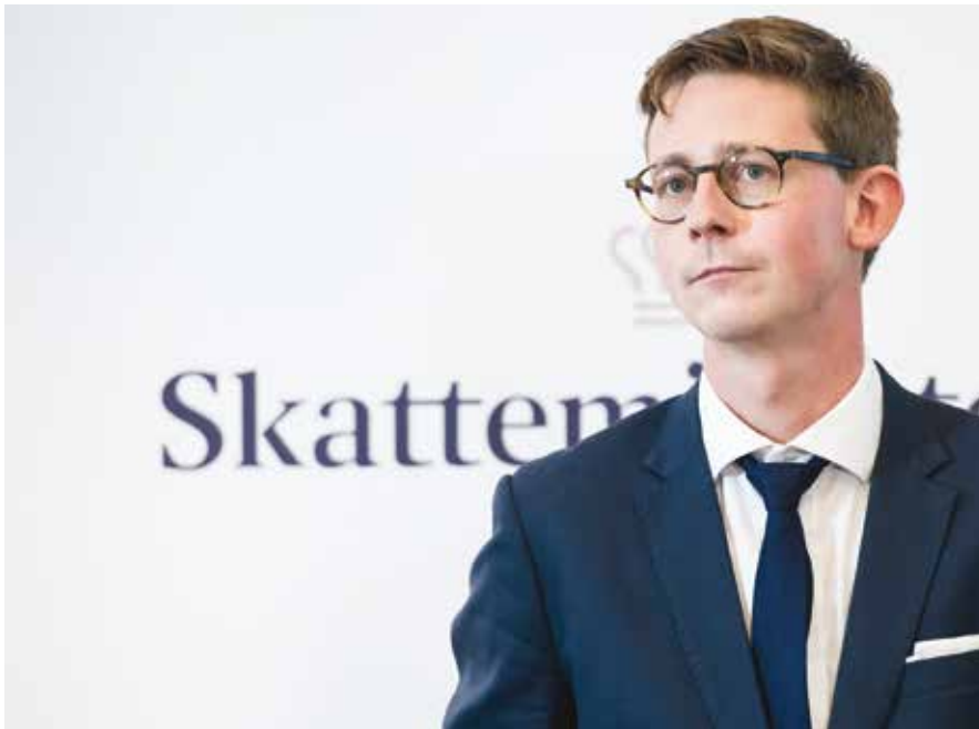
Skatteminister Karsten Lauritzen (V).