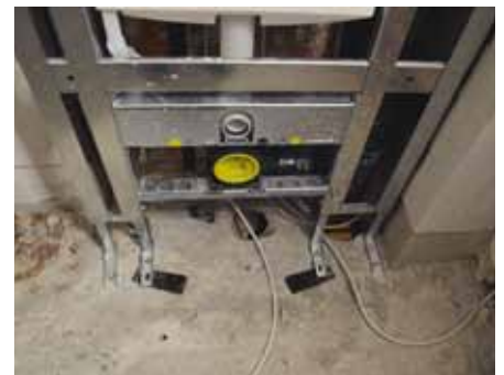
Akkordholder Per Eistrup fra ENCO sammen med 'Huterer'. Det er Eistrup til venstre.

hvordan indtjeningen på deres akkord ender med at blive.