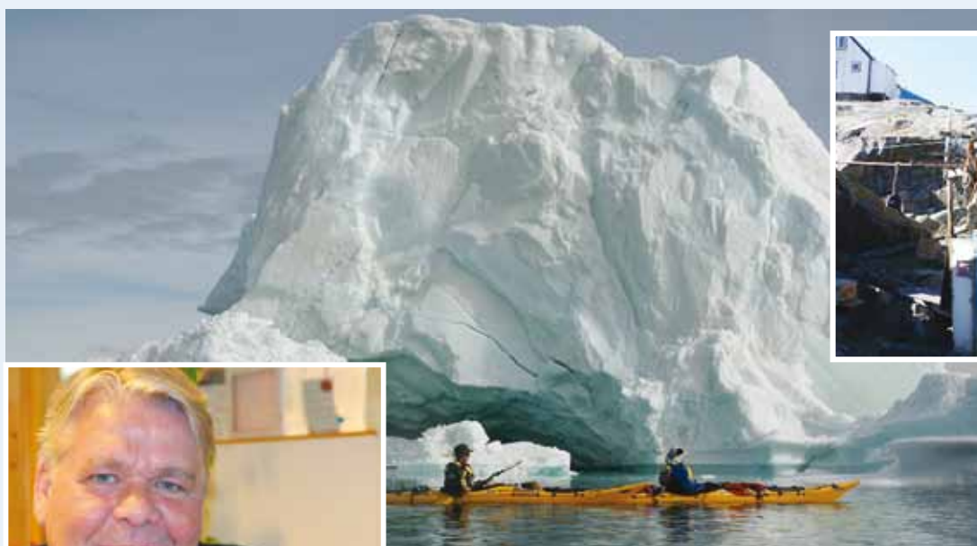
Uummannaq er en typisk fangerby