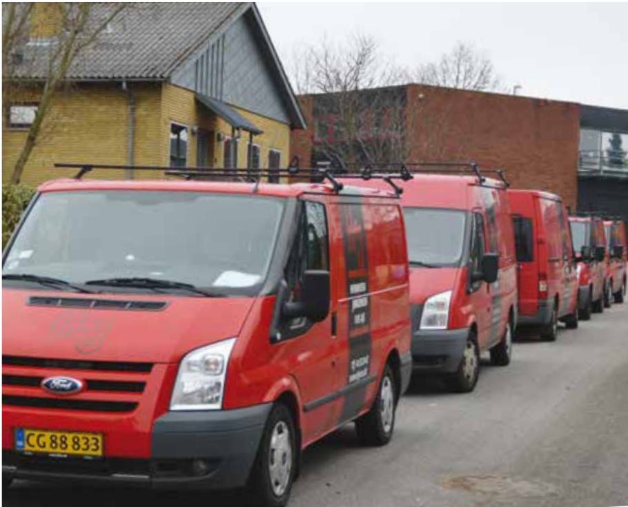
Symfonivej 33, 13. marts 2016: Firmabilerne er kørt til kantsten, en epoke er slut.

35 svende og fire lærlinge er med fuld musik blevet sparket ud af deres arbejdsplads på Symfonivej i Herlev. Det skete, da Skifteretten i Roskilde 16. februar erklærede aktieselskabet Henriksen & Jørgensen VVS konkurs