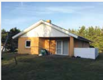
Huset i Houstrup