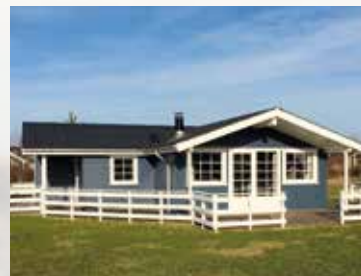
Huset i Bork