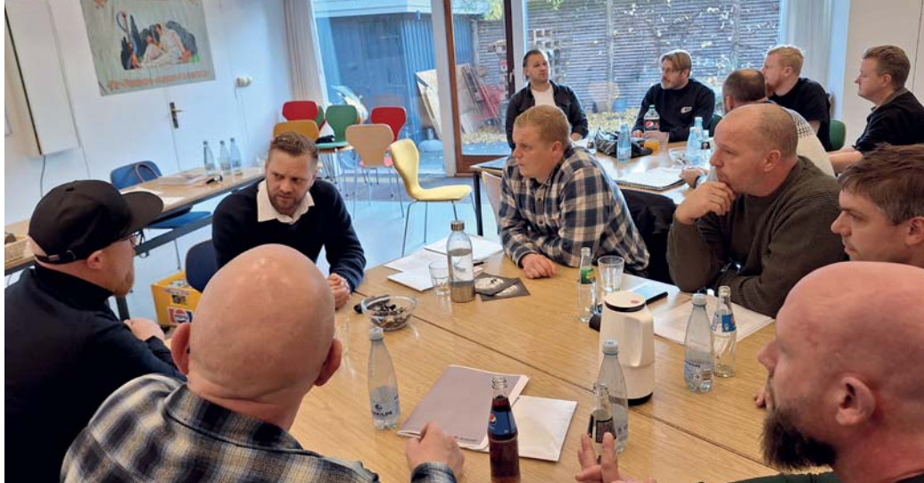
Undervisning vekslede mellem oplæg, debat og gruppearbejde