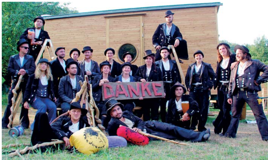
Axt und Kelle samles til Sommertræf.