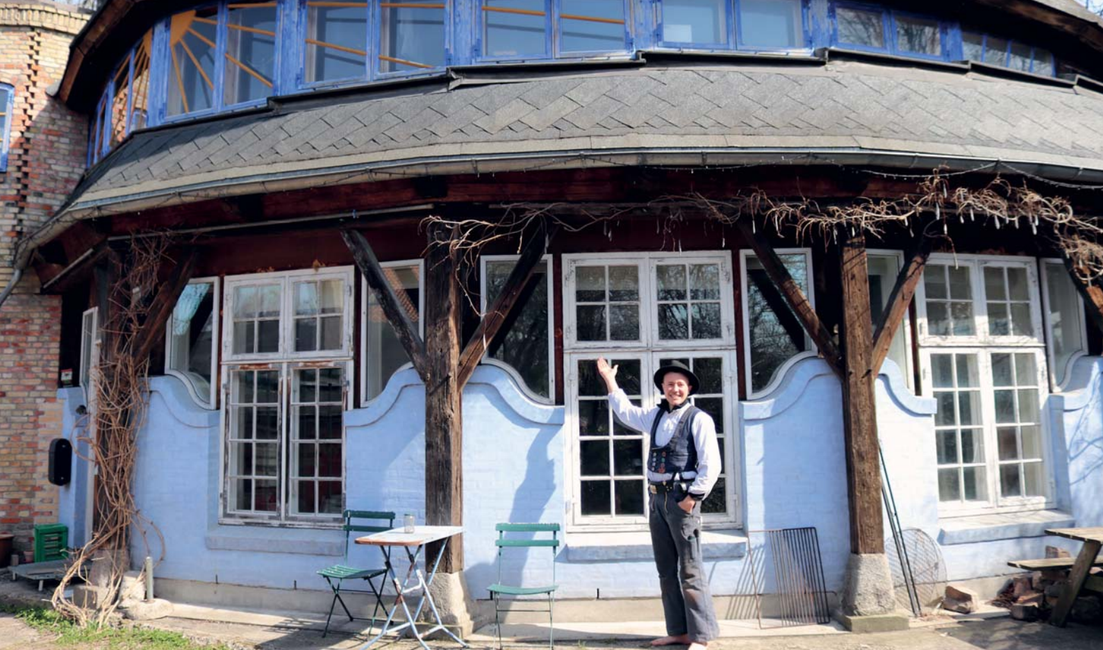
Alle slags håndværk er taget i brug på Bananhuset.