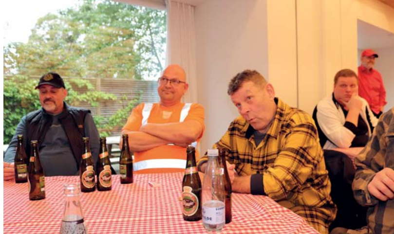
Kollegaerne fik lyttet til mange nye og faglige ideer.