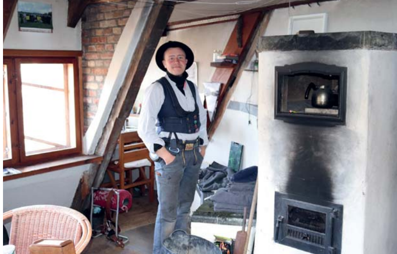
Bananhuset er bygget på stolper og nedenunder er der etableret en bolig