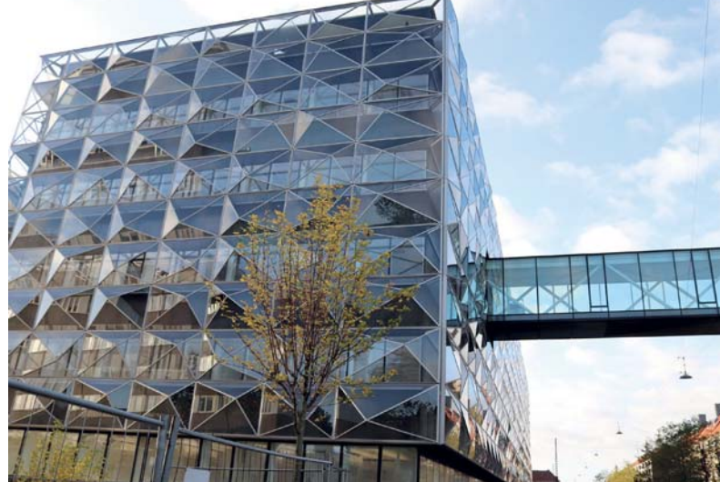
Niels Bohr Bygningen er et voldsomt dyrt prestigeprojekt til mange milliarder.