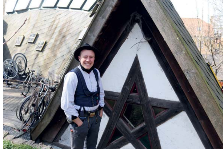
Alle slags håndværk er taget i brug på Bananhuset.

»Du deler økonomi med de andre navere, lærer og udveksler viden. Du arbejder altid solidarisk og løber aldrig fra dit ansvar.«