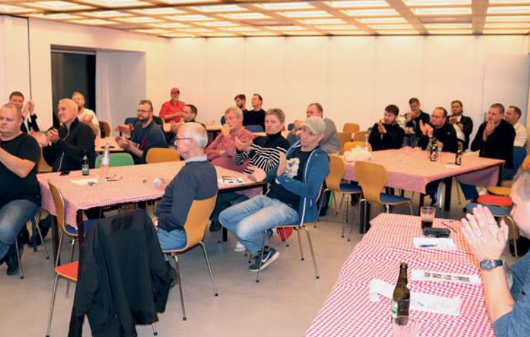
Der var en livlig debat og en stærk opbakning fra salen.