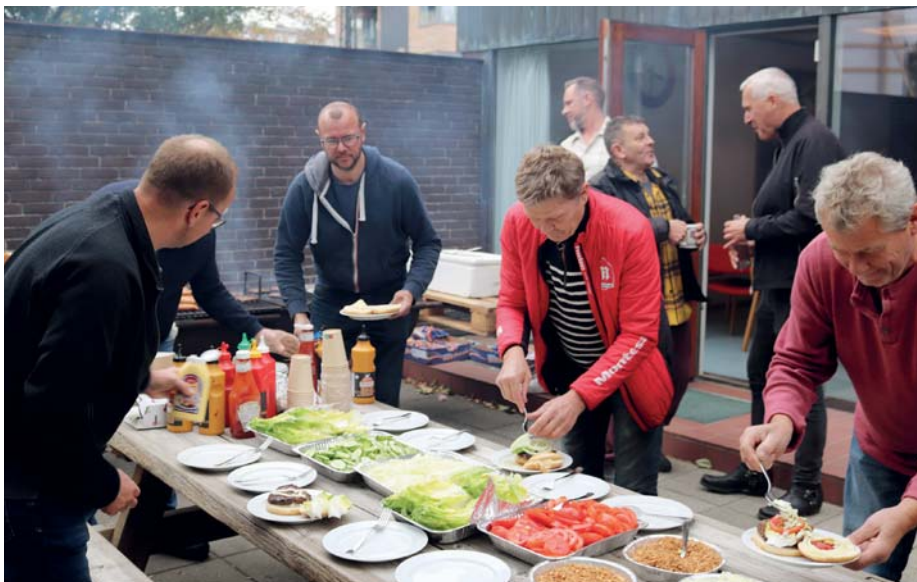
Rør & Blik tændte grillen som opvarmning til debatten.