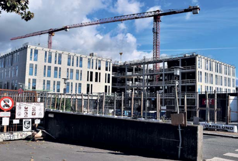
Hospital byggeriet i Hvidovre er igen alvorligt forsinket