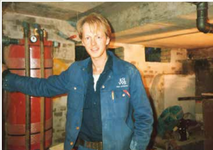
Nyudlært blikkenslagersven anno ca. 1985