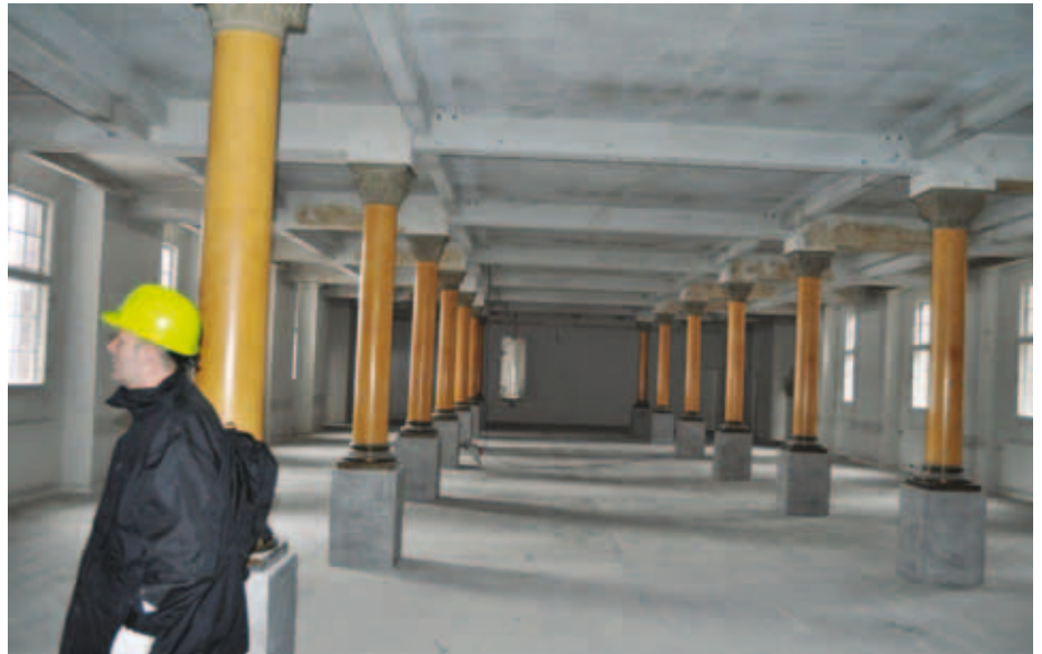
Nørregade: Her sad i sin tid side om side telefonistinder og stillede om til Bella, Øbro, Fasen og flere andre københavnske centraler.

Nørregade: Fast ugentlig rengøring gør noget ved helhedsindtrykket