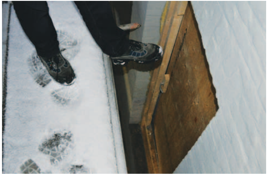
Tordenskjoldsgade: Sne på stilladset – og risiko for styrt.