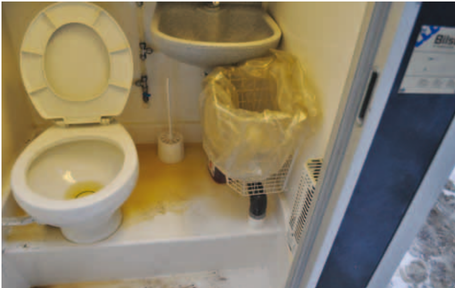
Rådhusstræde: Badeværelse og toilet for 40 håndværkere. Rådhusstræde: Kantine og opholdsrum for 40 håndværkere