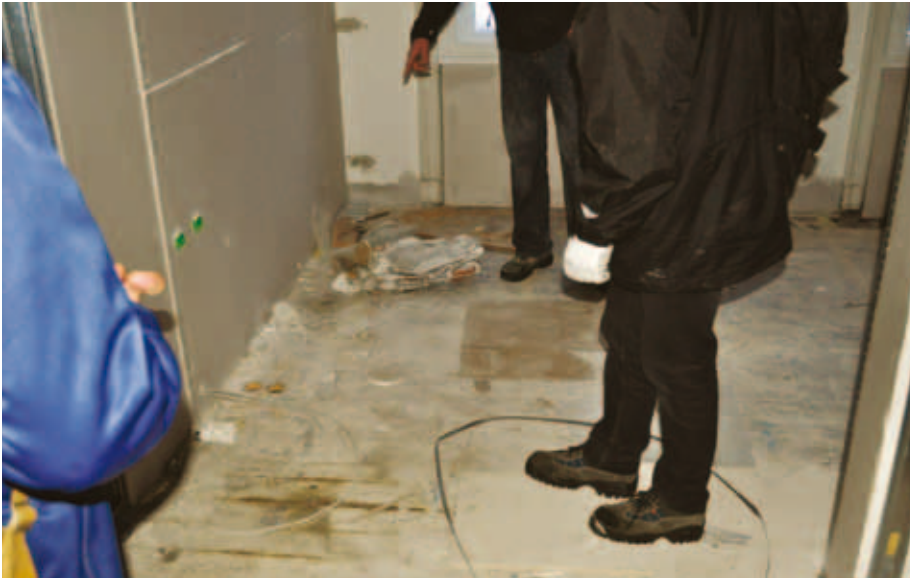
Tordenskjoldgade: Der bliver ikke ryddet op og gjort rent, især ikke i hjørnerne.