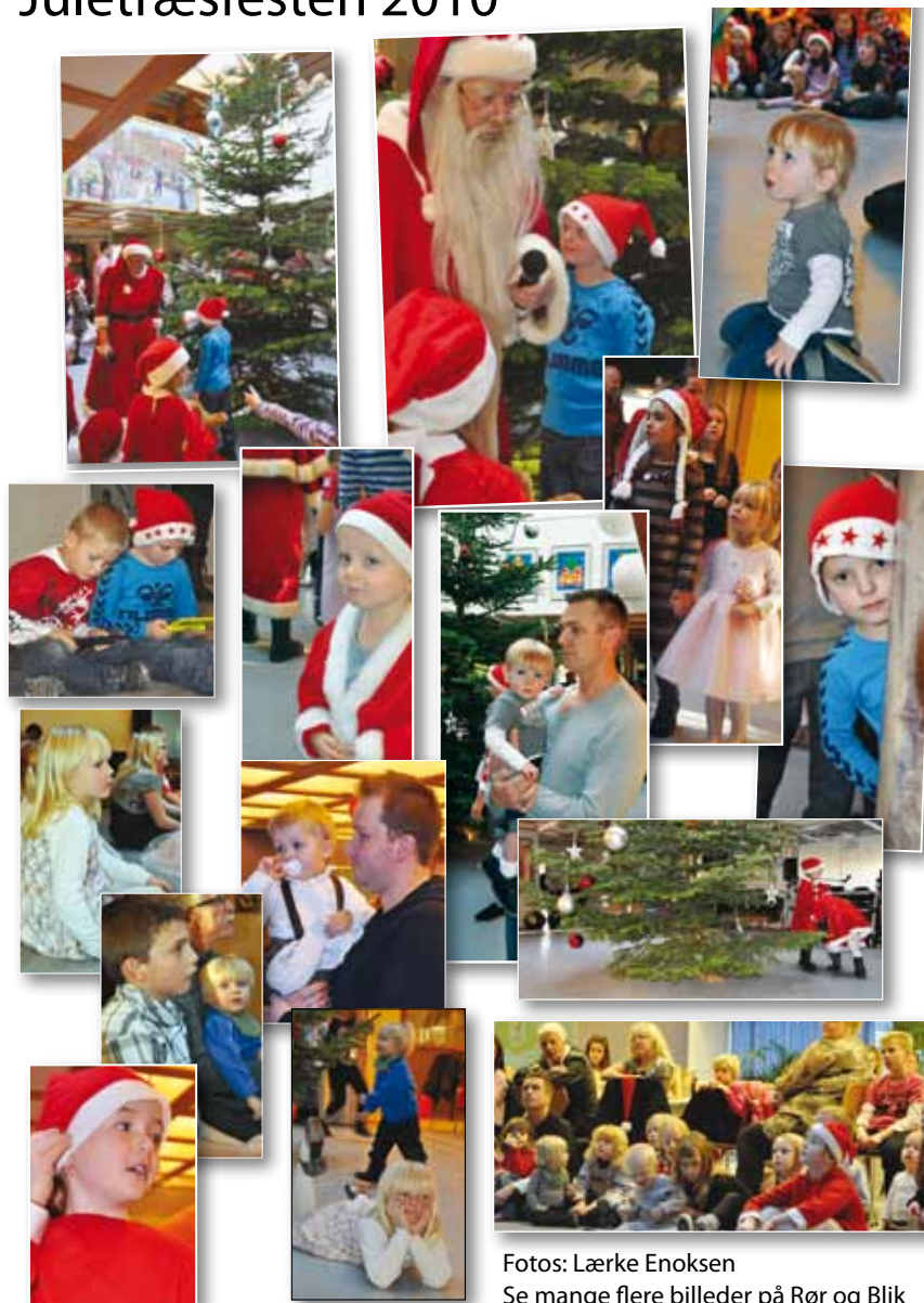
Se mange flere billeder på Rør og Blik Københavns Facebook-gruppeside

Orientering i førstehjælp med fokus på hjertestop.