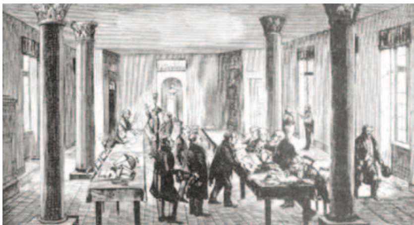
Tegneren P. Klæstrups tegning af en mesterprøve på Råd- og Domhuset er tydeligvis en blikkenslagerprøve.

Blikkenslagersvendene derimod så sig henvist til Herrens mark. Som uorganiserede stod de uden beskyt-