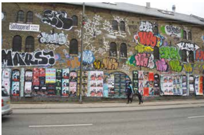
Loppen med facade mod Prinsessegade. Det overvejes at genetablere den langstrakte bygnings tre i dag tilmurende portåbninger.