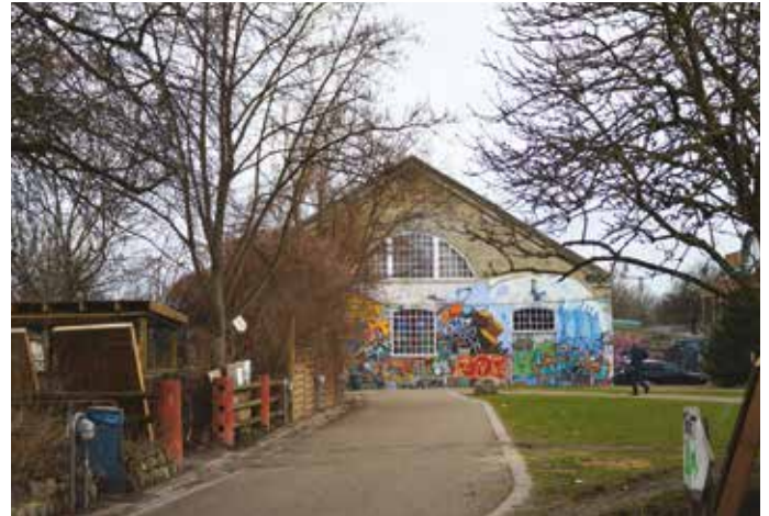
Den Grå Hal, Christianis største musikscene, tidligere med plads til 1000 gæster, nu, efter omfattende brandsikring, godkendt til 1780.