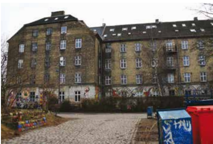
Fredens Ark. Bombesikret kasserne bygning fra 1837. I dag Christianias største beboelsesejendom. Trænger til en meget kærlig hånd.