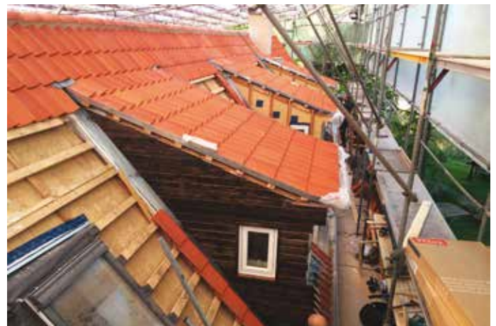
Tagrenovering på Dyssegården.

grundene til, at vi to sidder og taler sammen. Jeg håber nemlig, at det, der kommer ud af det, kan være med til at tiltrække nogle gode folk.«