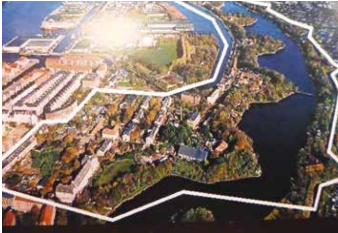
Christiania fra oven.