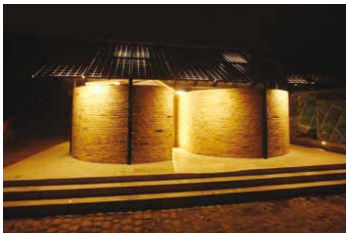
Nyopført toiletfacilitet på Carl Madsen Plads med solceller på taget.