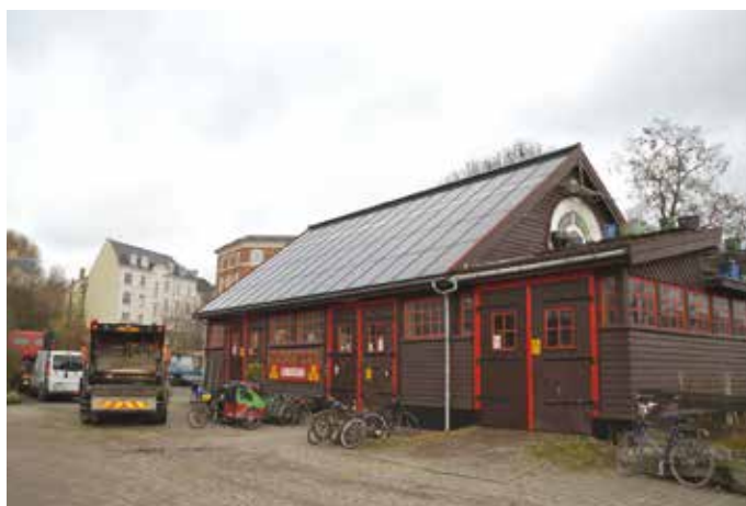
Maskinhallen. Stod hos Nordisk Kabel og Tråd på Frederiksberg, blev pillet ned, nummereret, transporteret og af christianitter sat op i deres fristad. Dygtigt arbejde, kan selv.

at interviewet ikke skal handle om hash-problematikken på Christiania. Et enkelt spørgsmål skal dog stilles.