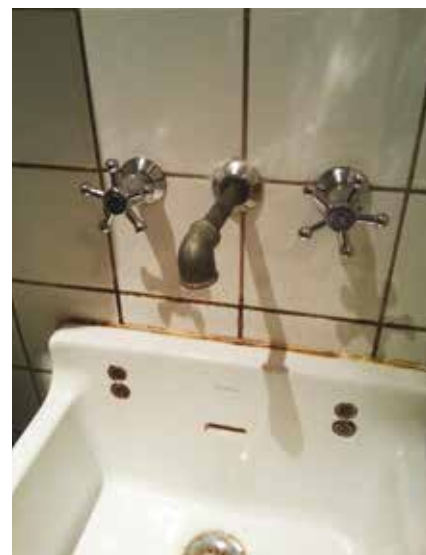
Tja... (set i Esbjerg).