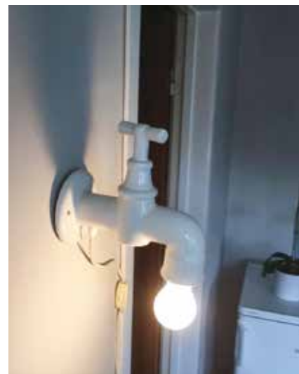
Set hos en kunde i dag. Den må være monteret af en el-mand.