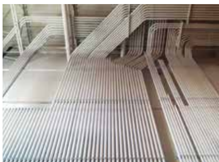
Alupex, alupex og mere alupex.

Til hvert opslag er der i anonymiseret form gengivet nogle af de mest slående kommentarer.