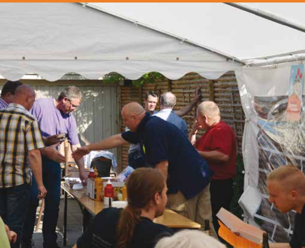
Samlingen var i år skiftet ud med selv-grillede frankfurter. Det lod til at bekomme folket.

rigtig godt. Det piner og nager selvfølgelig arbejdsgiverne, at de ikke har fået klemt os, som de har fået klemt andre.