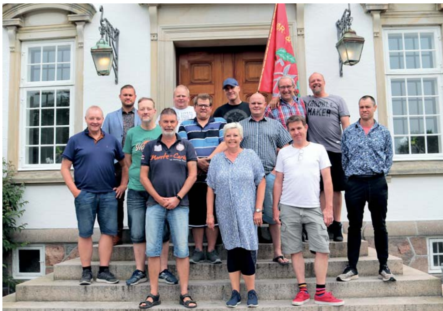
Medarbejdere og bestyrelse på LO-skolen