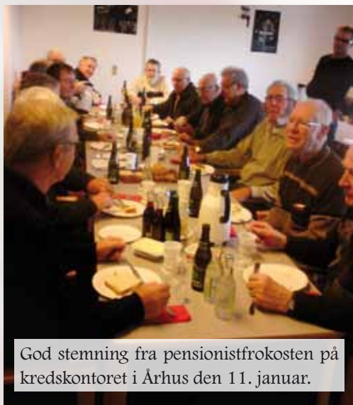
God stemning fra pensionistfrokosten på kredskontoret i Århus den 11. januar.

Dato for årets pensionistudflugt er onsdag den 1. september og målet bliver Mols og Ebeltoft.