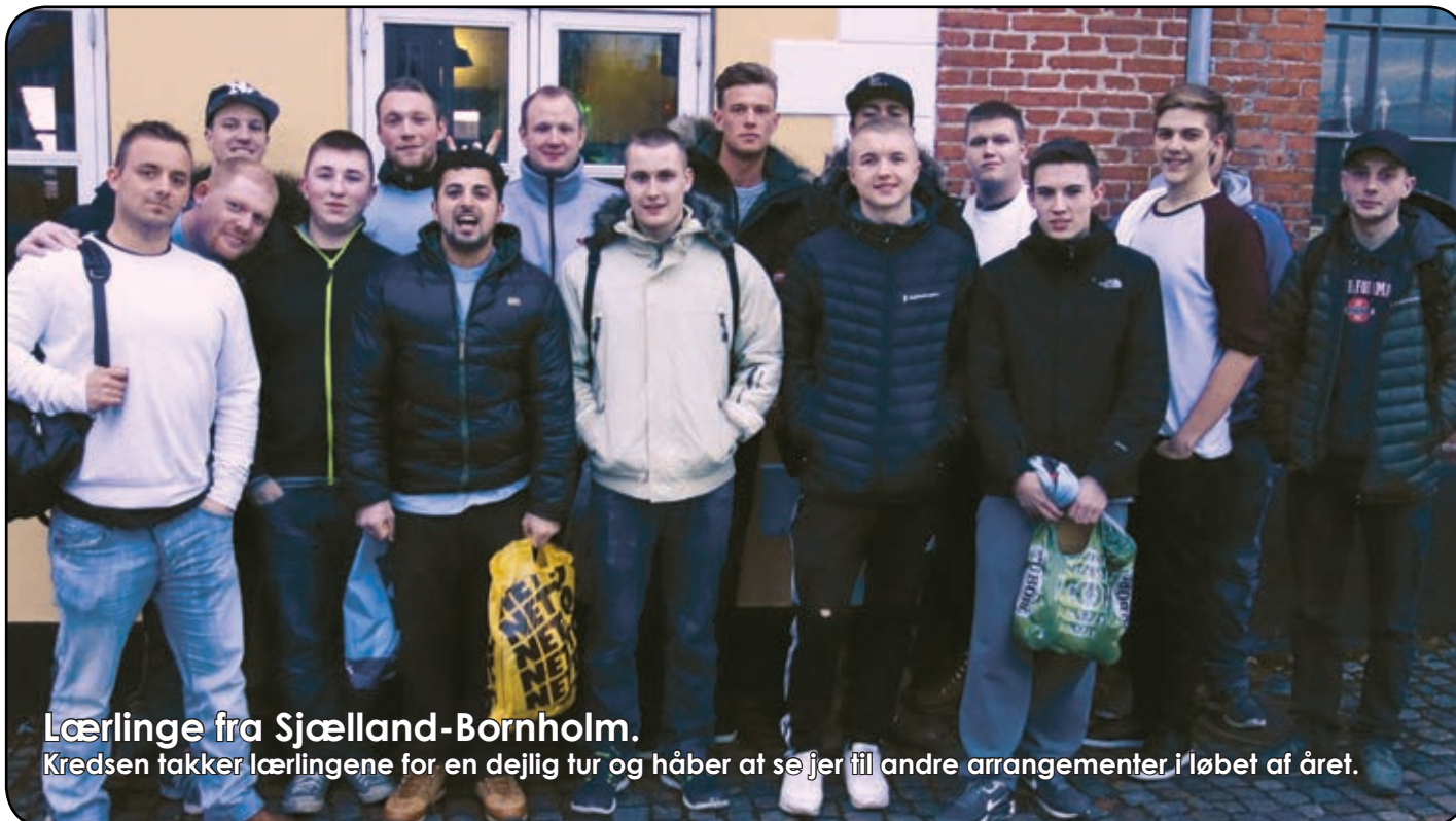
Lærlinge fra Sjælland-Bornholm.

Kredsen takker lærlingene for en dejlig tur og håber at se jer til andre arrangementer i løbet af året.